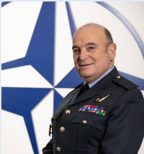
Головний маршал авіації Стюарт Піч Голова Військового комітету НАТО