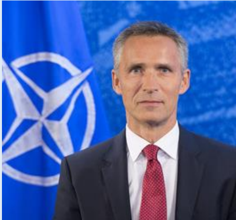
Йенс Столтенберг Генеральний секретар НАТО