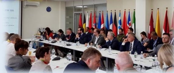
Donor Coordination Meeting, NRU