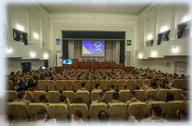
Training for cadets and officers, National Guard of Ukraine