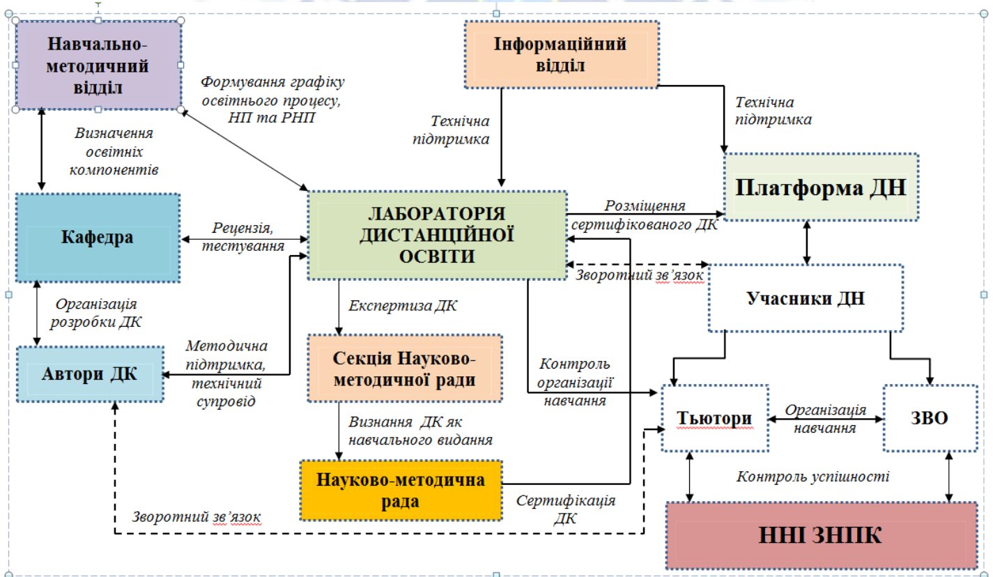
Рис. 1 Модель організації освітнього процесу з використанням технологій дистанційного навчання