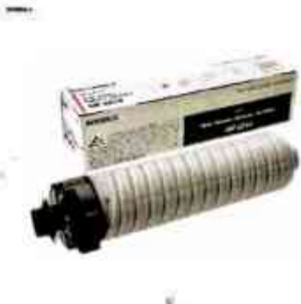
Совместимый тонер картридж Ricoh A500 MP4054/5054/6054 INT