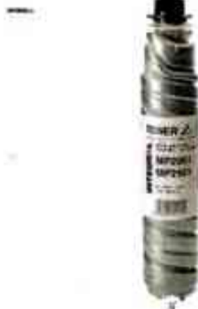
Совместимый тонер картридж Ricoh A500 MP 2001/1501/1P2401B/1501 INT