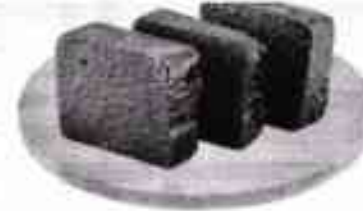
Наполнитель Джем Апельсин-Облипка 1 кг